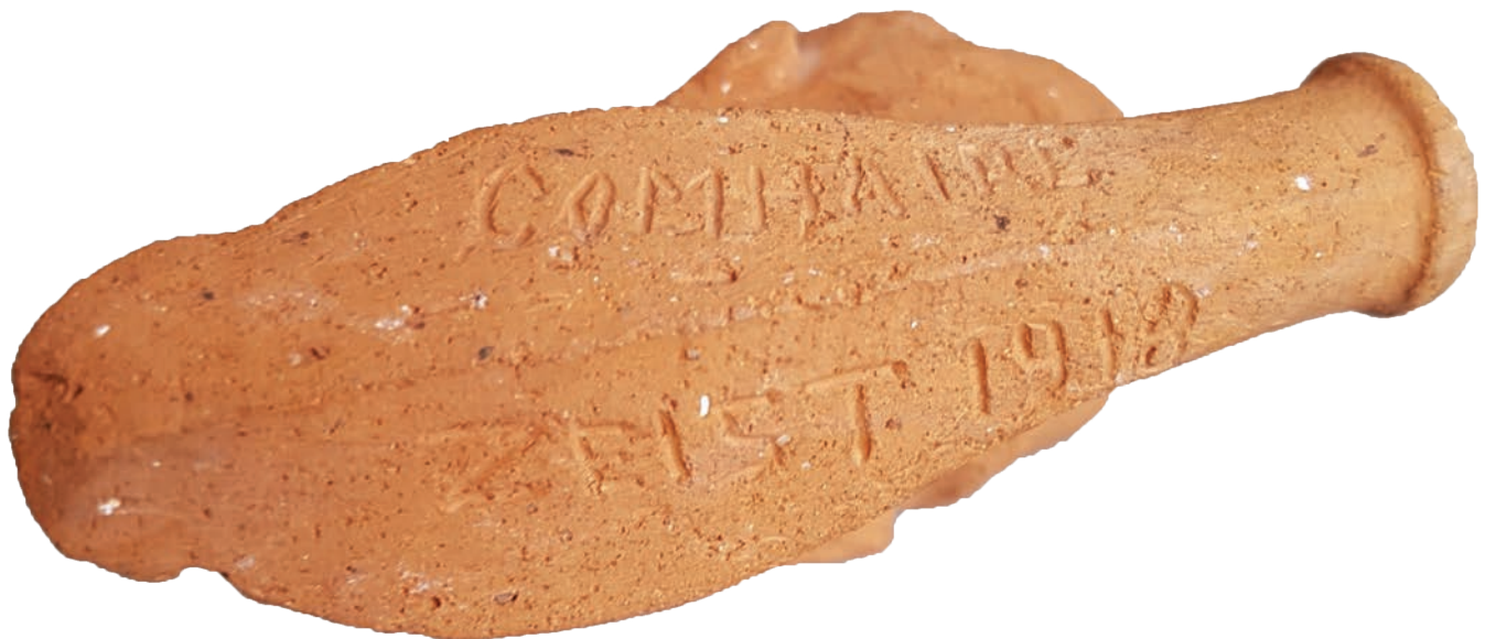
Afb. 2. Onderzijde van de handgevormde pijp, Comhaire / Zeist 1918. Particuliere collectie.