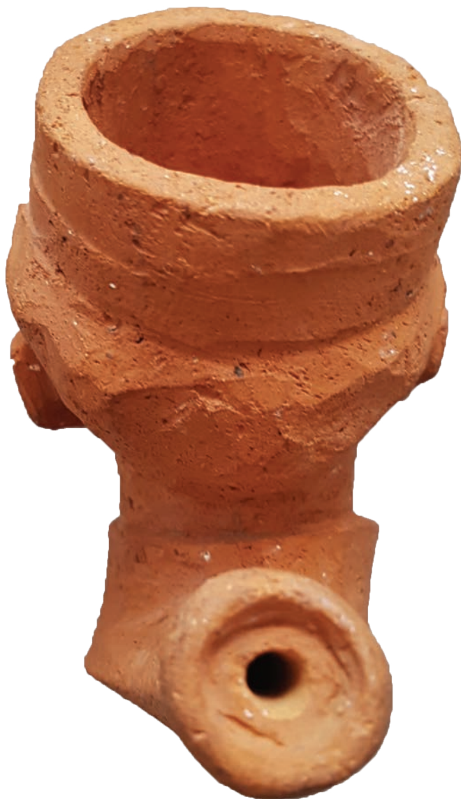
Afb. 3. Steelaanzet van de 'Comhaire' pijp. Particuliere collectie.