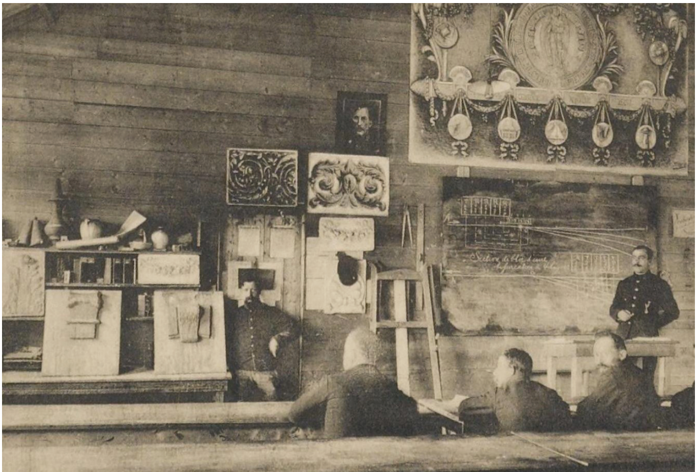
Afb. 6. Leerzaal van de beeldhouwers. Werkschool interneringskamp Zeist, 1914-1918. (website http://belgengezocht.nl ).