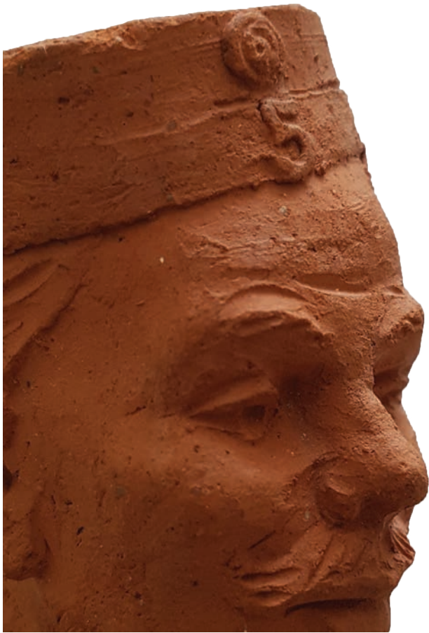
Afb. 4. Detail met militaire muts. Particuliere collectie.