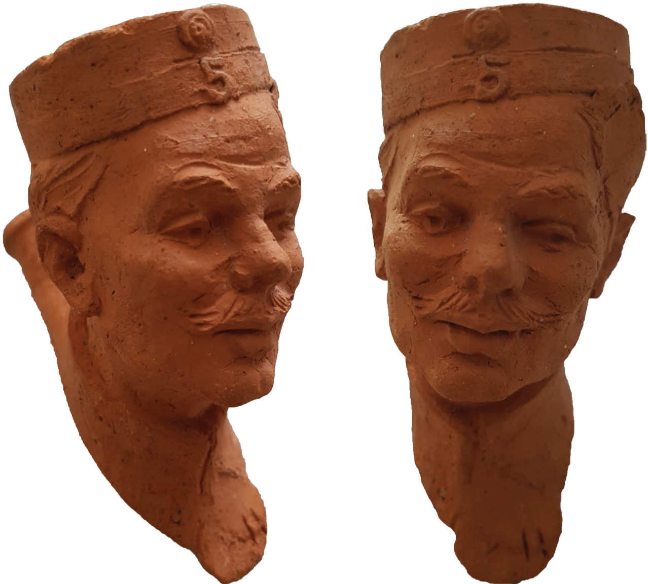
Afb. 1a-b. Handgevormde pijp, Comhaire Zeist 1918. Particuliere collectie.

De pijp is vormgegeven als het portret van een man met snor en pet. Het hoofd is opzettelijk iets schuin geboetseerd (afb. 1a-b). Op de voorkant van de pet staat het cijfer '5' en op het uitsteeksel onder zijn kraag een slecht leesbare letter, mogelijk een 'K' en daarnaast 'II'. Op de linker onderzijde is de naam 'Comhaire' ingesneden en op de rechterzijde 'Zeist 1918' (afb. 2). De steelinzet is ondiep en loopt door in een smal rookkanaal (afb. 3).