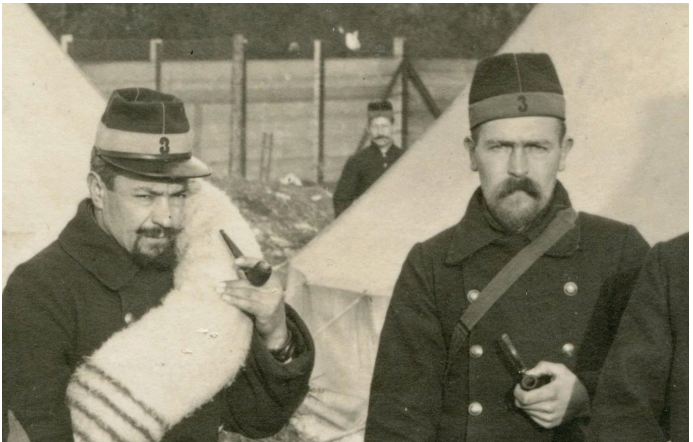
Afb. 5. Belgische militairen in Amersfoort.