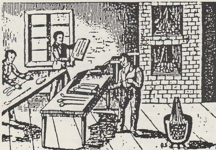
"Die Schoenecker Pfiffeköpf"

Dit betekende het einde van de pijpenfabricage.