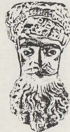
S.F. N° 793