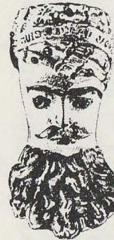
S.F. N° 785bis