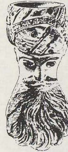
S.F. N° 786