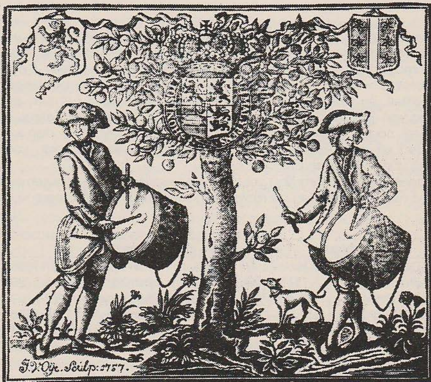
NIEUWE JAARS ZEGEN-WENSCH, Door de Burger-Tamboers der Stad GOUDA, Op den Ingang van het Jaar onze HEEREN, 1759.