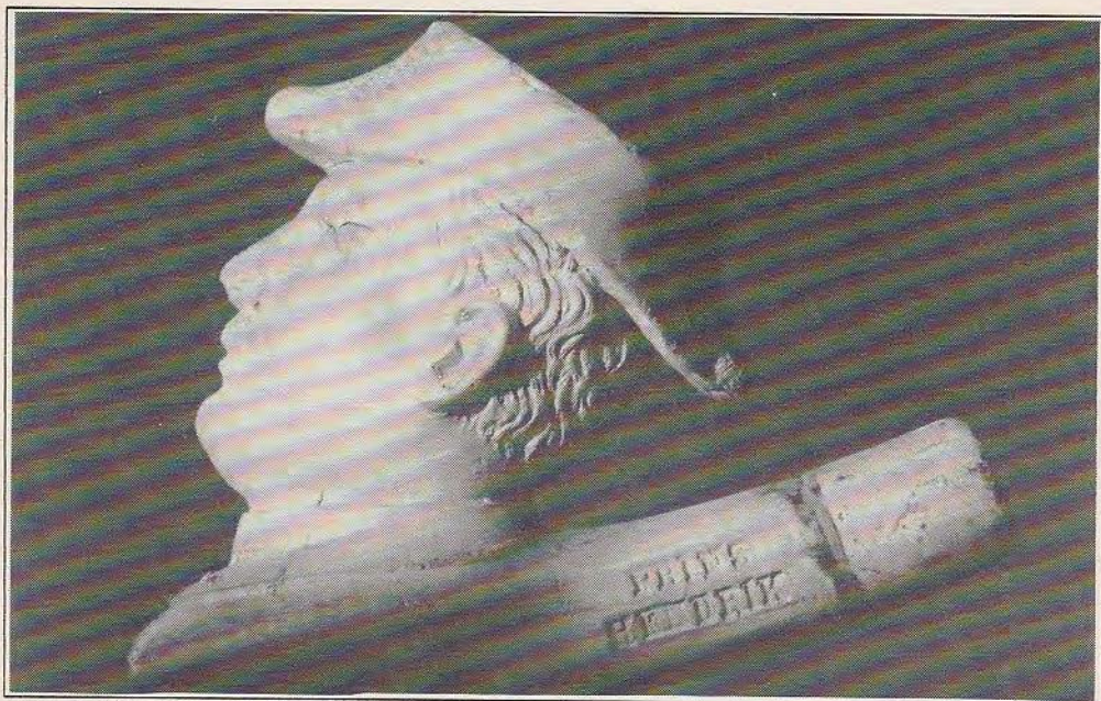
Afb. 1 Prins Hendrik, firma Wingender

Een jaar of drie geleden kwam ik via een graver in het bezit van een fraaie manchetpijp voorstellende prins Hendrik, echtgenoot van Wilhelmina, afgebeeld met een tweekantige steek ( afb. 1 ). Op de zijkant staat de tekst: PRINS HENDRIK. Deze pijp was voor mij niet te plaatsen wat land van herkomst en maker betreft. Wel wist ik dat een pijp met een soortgelijke beeltenis in catalogus nr. 6 van Goedewaagen staat afgebeeld. Het gaat hier echter om een steelpijp, maar de belangrijkste kenmerken: de tweekantige steek en de gelaatstrekken, zijn vrijwel identiek. Deze Goedewagenpijp was niet als oranje pijp bedoeld, maar door de grote gelijkenis met Prins Hendrik toch geworden. Nu was ik enige tijd geleden mijn catalogi aan het doorkijken en tot mijn stomme verbazing zag in de catalogus van de firma Julius Wingender & Co uit Höhr, Nassau (Duitsland) een afbeelding van mijn pijp. Hij staat afgebeeld op pag. 9 onder nummer 1021, met als bijschrift: PRINZ HENDRICK ( afb. 2 ).