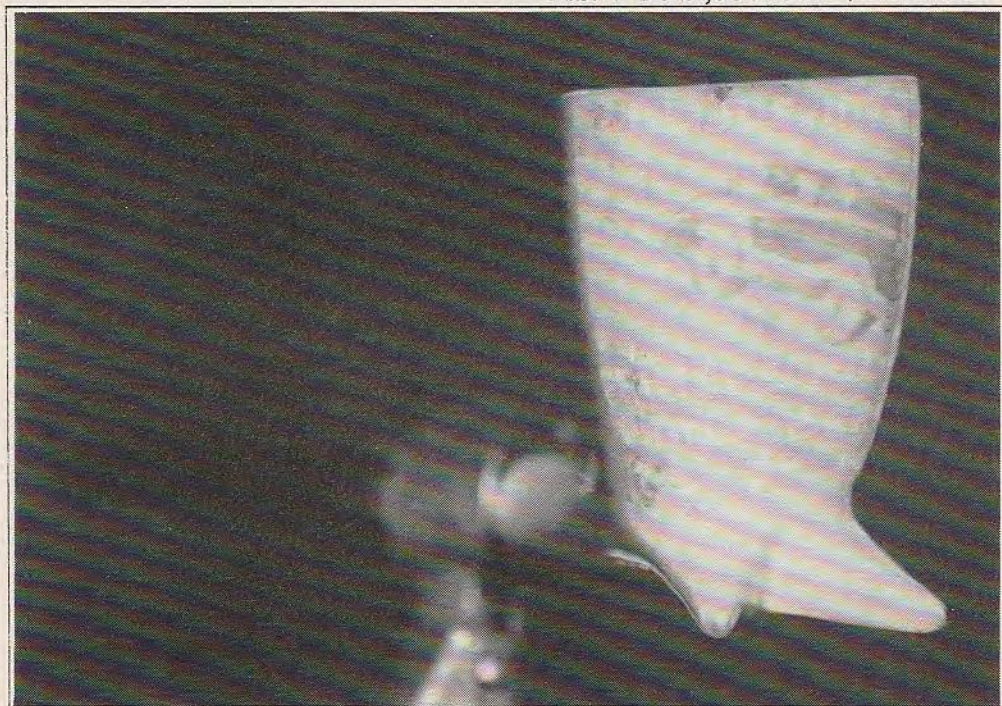
Afb. 4 "De blijde intocht", firma Zenith