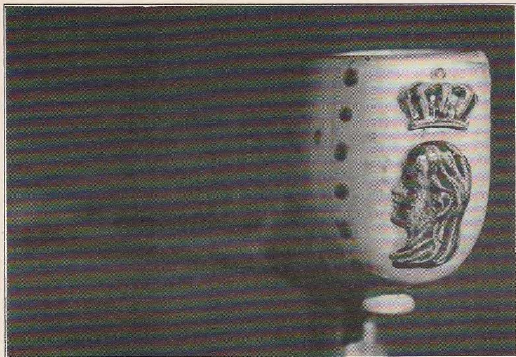
Afb. 3 Wilhelmina, maker onbekend