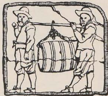
Afb. 3 Bierdragers op gevelsteen