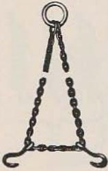
Afb. 2 schenkelhaak

Het bestaat uit een draagboom met daaraan een soort schenkelhaak (of schinkelhaak). Een schenkelhaak is een stuk gereedschap dat gebruikt wordt om vaten op te hijsen ( afb. 2 ): het is een ketting (strop) met aan beide uiteinden een haak.