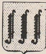
Afb. 5 Wapen van Zwijndrecht met drie schoorsteenaken

Z. Kolks et al., 1985. Kunst om bier . Rijksmuseum Twenthe, Enschede.