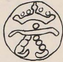
Afb. 1 merk de bierboom

1 Een hangijzer , ook wel haal, heugel, schoorsteenhaak of ketelhaak geheten is een getand, verstelbaar ijzer, waaraan men een ketel boven het vuur hangt. ( afb. 5 ).