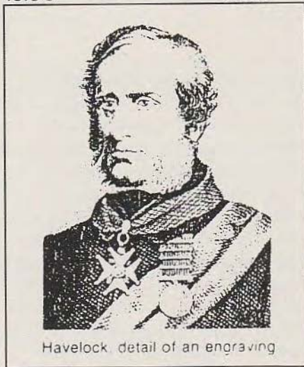
Havelock, detail of an engraving