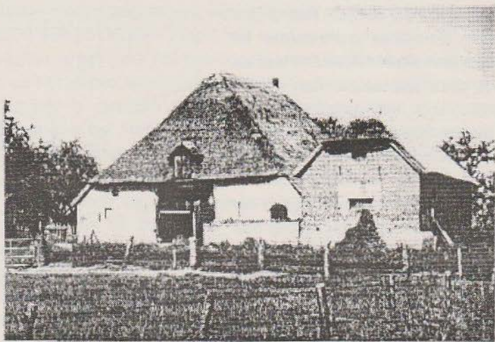
De Brouwketel in de jaren 1960, gezien vanuit het zuiden. Rechts de vledershuur (= stal voor het vee bij hoog water)