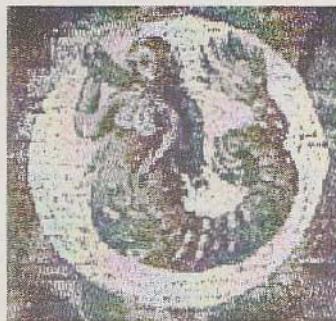
Het merk Triton op het Draaggildebord

De meermin behoort tot een uitgebreid geslacht van meermensen. Zo zullen de meesten van ons ook wel het merk Triton "de zoon van Poseidon en Amphitrite" kennen wat eigenlijk een meerman is. In de Griekse Mythologie is Triton een zeegod, half man met een vissenstaart, die op een schelpenhoorn blaast om de golven rustig te krijgen. Triton regeerde de zee samen met verscheidene broers onder het toezien van zijn vader de zeegod Poseidon.