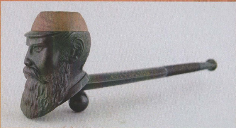
Dr. W.G. Grace Gutta percha pijp met bruyère binnen ketel