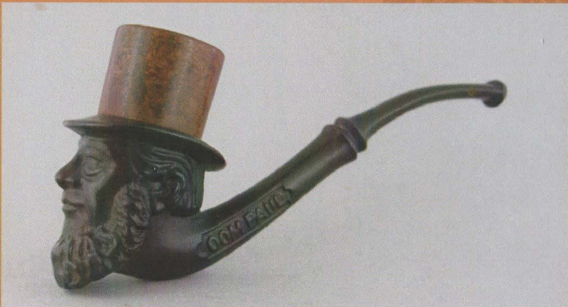
Paul Kruger Gutta percha pijp met bruyère ketel.