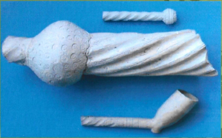
Afb. 5, Reuzensteel met het merk "Haan"