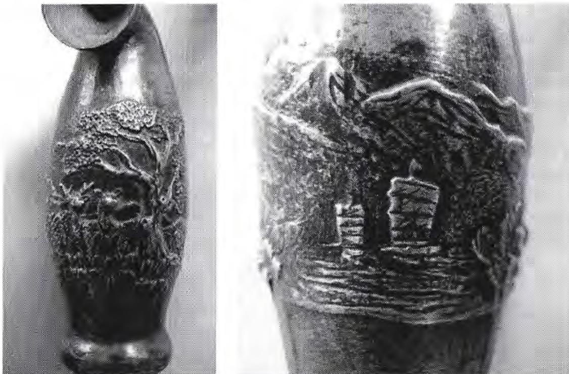
Detailopnames van de op deze pagina genoemde kiseru

De fraaie gedreven reliëfvoorstellingen op de gedecoreerde pijp zijn klassiek Japans en getuigen van groot valmanschap. Op de steel een berglandschap met herten en op het mondstuk twee schepen tegen een rotsachtige kustlijn.