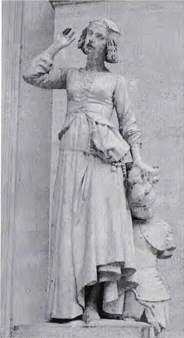
Jeanne d'Arc, 1852. Dit beeld staat in het Louvre in Parijs.

bestaat uit een grote zuil van marmer met daarbovenop een prachtig bronzen borstbeeld van Francois Rude. De grote gelijkenis met de pijp van Fiolet viel direct op en dat bracht mij op het idee om hierover een artikel te schrijven.