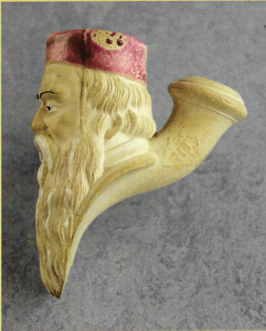
Francois Rude Fiolet à st Omer