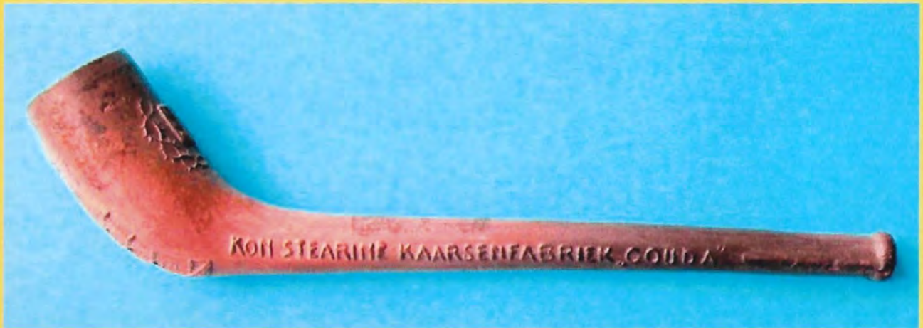
Herdenkingspijpe van de Koninklijke Stearine Kaarsenfabriek in Gouda (1858 – 1908) Zie artikel op pagina 2194