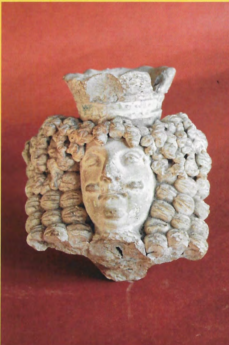
Een van de pijpen- koppen die hoort bij de driekoppige presentatiepijp. Onduidelijk is wie de afgebeelde persoon is, maar het moet haast wel iemand zijn van vorstelijke huize gezien de kroon op het hoofd. Zie voor meer details artikel op pagina 2198