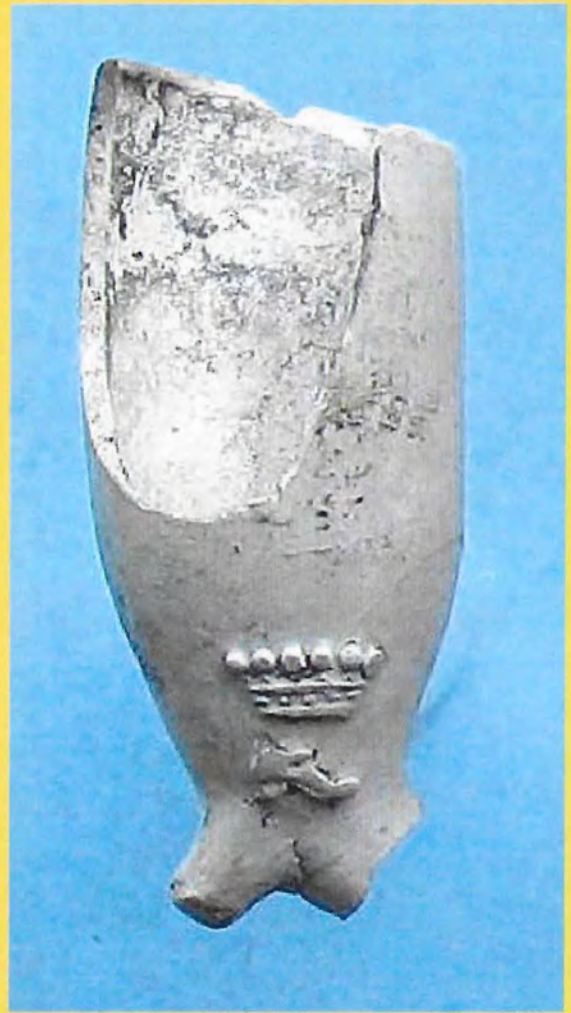
Opgegraven pijpen op de scheepswerf Oostenburg. Zie artikel op pagina 2213