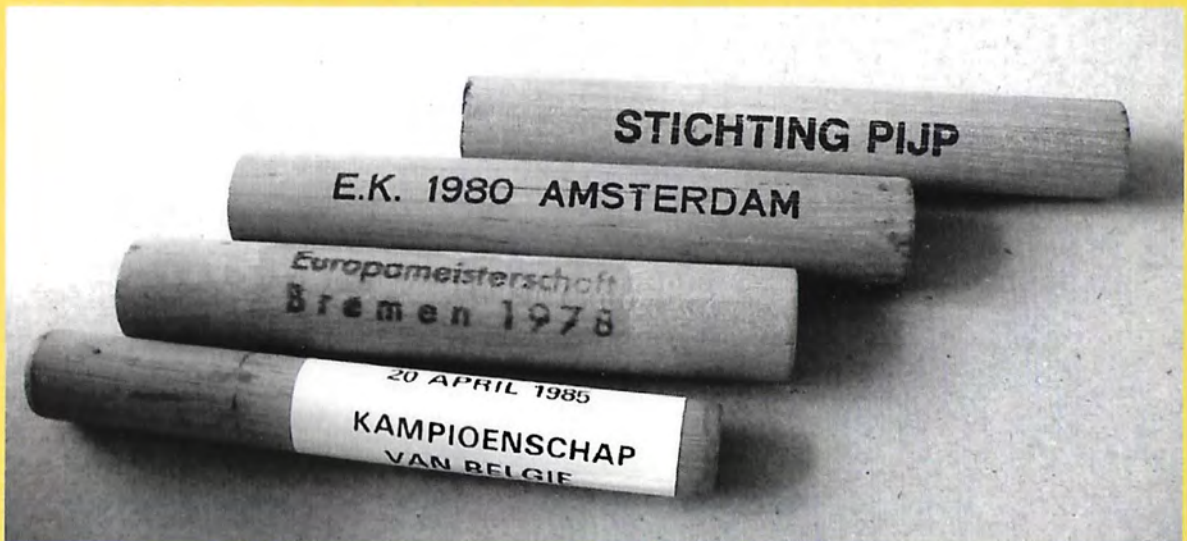
Houten pijpenstoppers. Zie pagina 2222