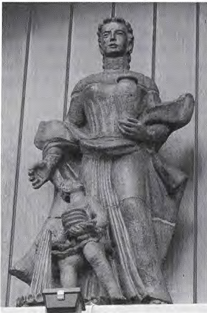
Een van de beelden gemaakt van chamotteklei die de ambachten van Gouda uitbeelden

De beelden zijn gemaakt van gebakken chamotteklei, opgebouwd uit verschillende delen en gevuld met cement. De elf beelden zijn uitgevoerd en in 1948 geleverd door Goedewaagen's pijpen- en aardewerkfabriek. Goedewaagen maakte wel vaker bouwceramiek en beelden. Zo is het