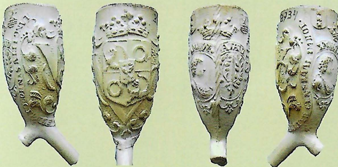
Gelegenheidspijp (1743-1755) ter ere van Gouverneur-generaal Gustaaf Willem van Imhoff. Zie artikel op pagina 2342