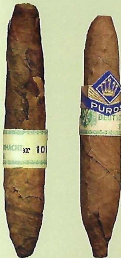
Nederlandse sigaren voor de Wehrmacht. Zie blz. 2333