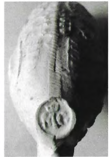
Afb. 2. "t VORSTELYKE HUYS V. ORANIE". Hielmerk: gekroonde MG. Hoogte 48 mm.