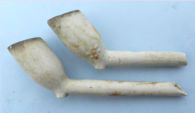
Gebroken pijpen onder een Amsterdamse vloer (pag. 53)