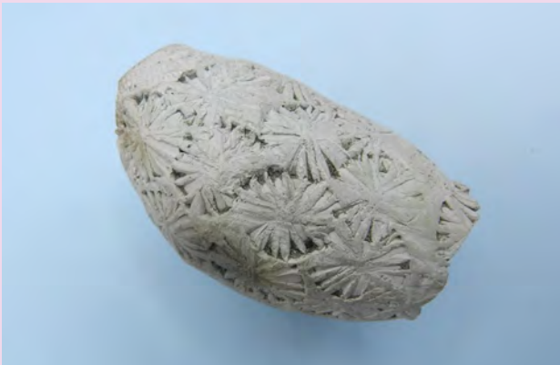
Een vroege pijpenkop met omhulsel (pag. 68)