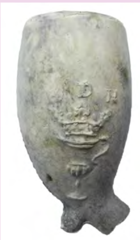
Kleipijpen van de Jan Kortland- straat en de Koestraat/ Kruis- poortstraat in Schoonhoven (pag. 58)